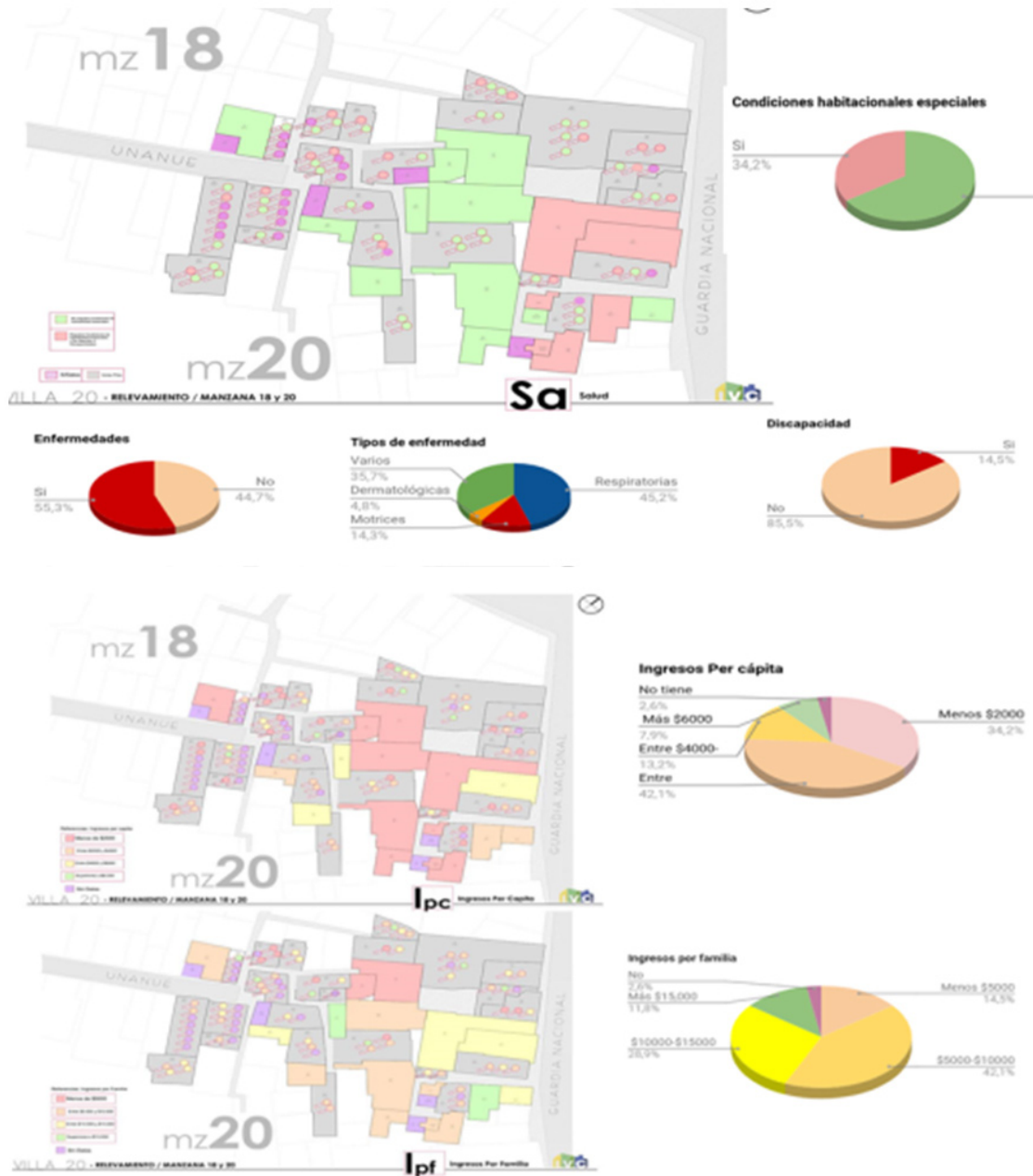
Figura 4: Diagnóstico del sector producto de la información del RELSE