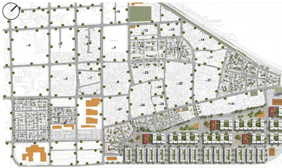
Figura N° 5: Sectores y manzanas del barrio con proyecto de ordenamiento acordado

a las mismas. El Espacio de Consulta se desarrolla en la Oficina Territorial de Gestión del IVC instalada en el barrio, con una frecuencia semanal y una concurrencia de alrededor de 50 personas por semana. Las principales consultas se refieren al proceso de intervención del PIRU, la realización del RELSE, las fechas de realización de reuniones y talleres, y situaciones derivadas de conflictos en la relación de dueños e inquilinos, entre otras. En este espacio se comunica la información referida al proceso de re-urbanización: las soluciones habitacionales previstas, las condiciones de relocalización y los conflictos entre vecinos. Con el fin de lograr canalizar la demanda se realiza un registro semanal de con-