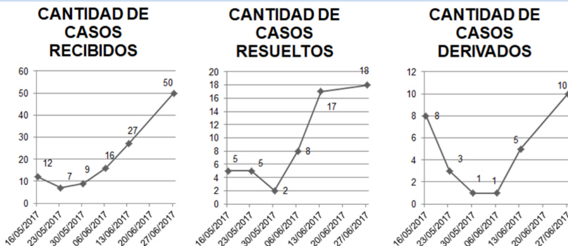
Figura N° 6. Registro mesa de consulta

Una vez acordado el PIRU de apertura o manzana se realizan entrevistas con cada una de las familias afectadas por los proyectos de ordenamientos. El objetivo de las reuniones con las familias total y parcialmente afectadas es informar detalladamente los motivos de la afectación de la familia al proyecto de re-urbanización de la man-