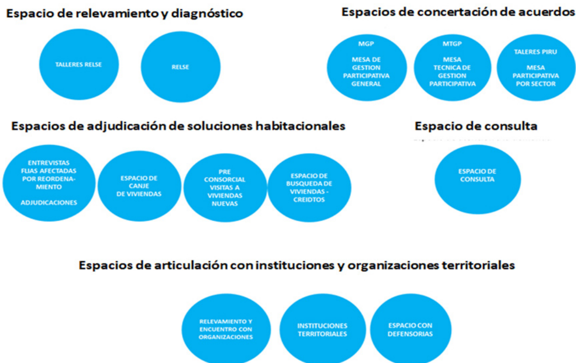
Figura Nº 3: Dispositivos de soporte del proceso participativo de villa 20

En relación a las herramientas utilizadas para poder conocer a la población del barrio, posterior al censo realizado en el año 2016, comenzó a ejecutarse el Relevamiento Socio Espacial (RELSE) de todas las viviendas del barrio. Esta metodología se convierte en uno de los primeros pasos de in-