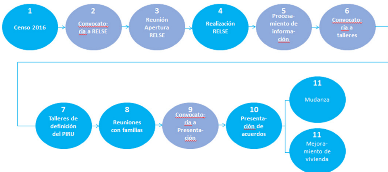
Figura Nº 2: Pasos metodológicos del PIRU