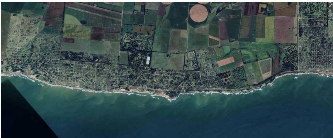
Imagen 3 - Chapadmalal, partido de Coronel Pueyrredón. Imágenes satelitales de los años 2003, 2013 y 2024.