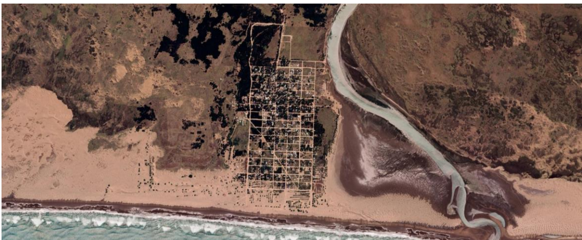
Imagen 4 - Marisol, partido de Coronel Dorrego. Imágenes satelitales de los años 2003, 2013 y 2023.

Problemáticas comunes a las localidades costeras.