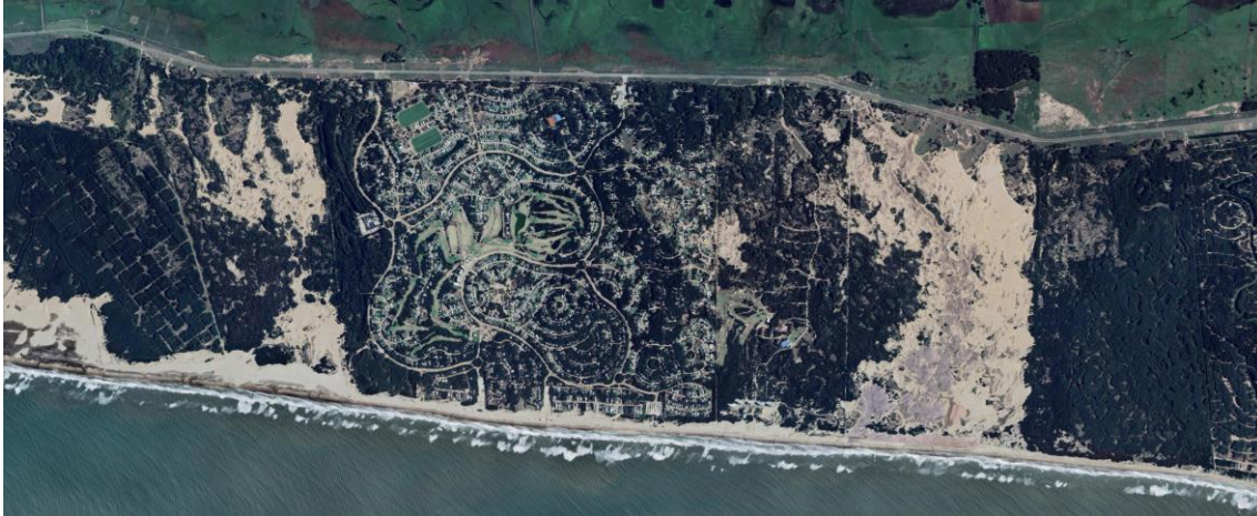
Imagen 1 - Costa Esmeralda, Partido de La Costa. Imágenes satelitales de los años 2003, 2013 y 2024.